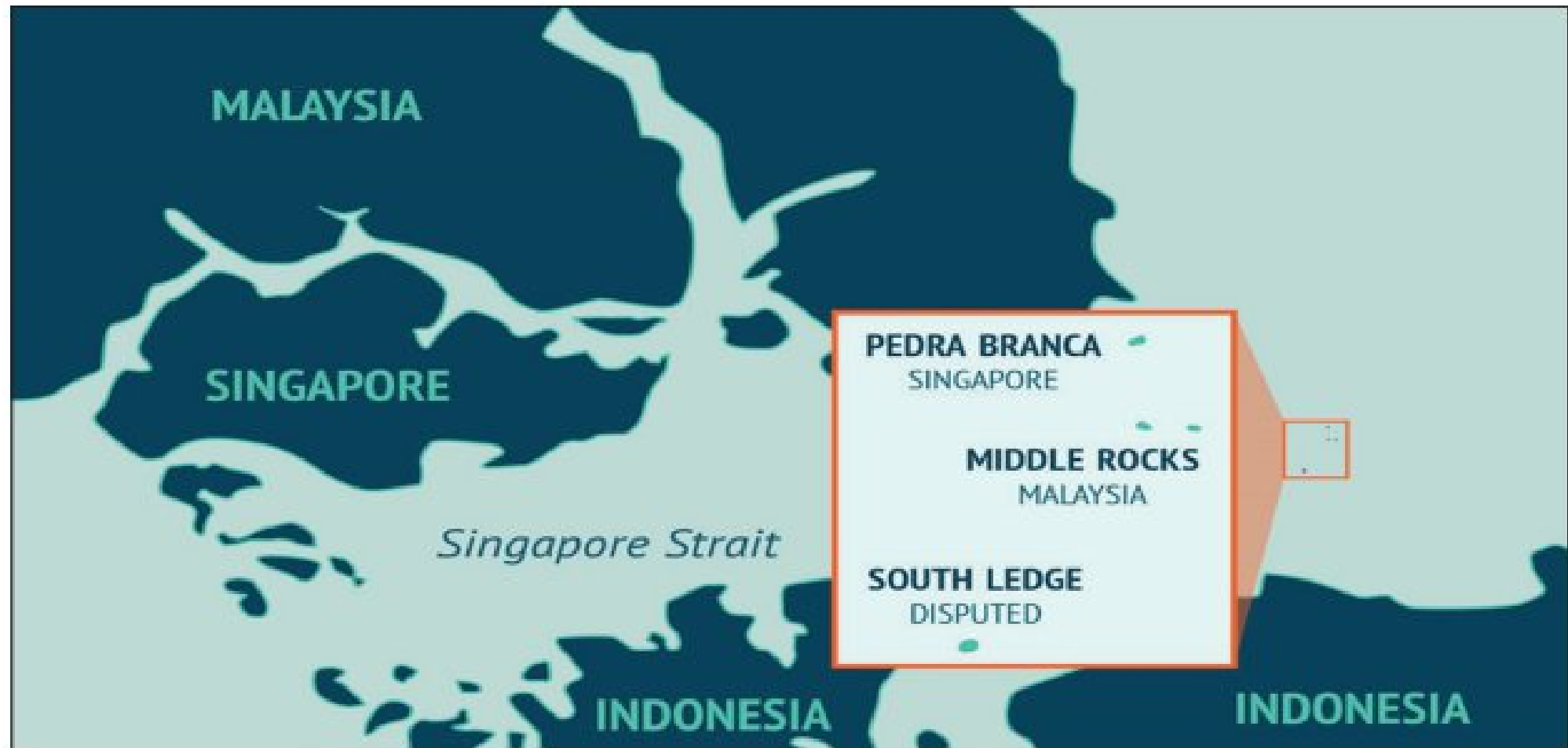
PETA 2. Pedra Branca, Middle Rocks dan South Ledge